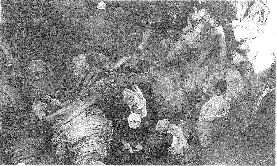
Abb. 1: Dallalmarkt für Schaffelle in Fès im Jahr 1984