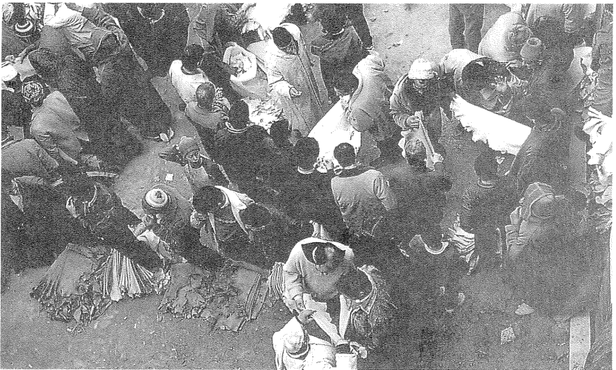
Abb. 2: Dallalmarkt für Ziegen- und Schafleder in Fès im Jahr 1992