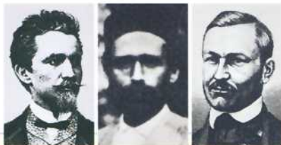
Gerhard Rohlfs Gustav Nachtigal Heinrich Barth