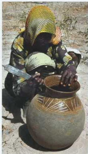
Auch heute noch wird in der Region auf traditionelle Weise getöpft und jene Keramik hergestellt, die im Zuge der Ausweitung der Machtsphäre des islamischen Reiches eingeführt wurde.

In Dikwa wurde ebenfalls eine kleine Grabung unternommen mit dem Ziel, das Alter der Siedlung festzustellen. Leider umfasst die Stratigraphie an der Stelle des ehemaligen Herrscherpalastes nur knapp 2 m. Deutlich sichtbar waren aber die verschiedenen Brandschichten aus dem frühen Kolonialkrieg.