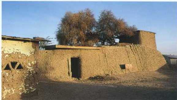
Außenansicht der Palastanlage von Ngalá. Während die Umfassungsmauern auch heute noch beeindruckend wirken, ist das Innere der Anlage seit der Mitte des 18. Jh. stark zerfallen.